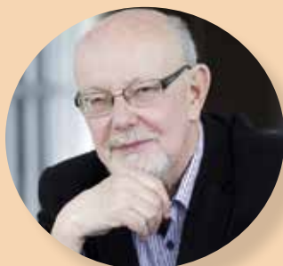
Jean-François Kahn De Marianne à Victor Hugo

Fondateur de «L'Événement du Jeudi» et de l'hebdomadaire «Marianne», Jean-François Kahn est un homme de médias. C'est aussi un auteur prolifique, historien de formation qui nous invite à découvrir le Victor Hugo «politique» à travers son ouvrage intitulé «Victor Hugo - Un révolutionnaire».