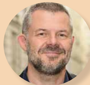
Éric Naulleau Critique littéraire... et sportif

« L'écrivain Georges Perec a osé cette disparition : retirer une lettre de ce tout qu'est l'alphabet. Je propose ici l'expérience inverse : affronter un tout à partir d'une seule lettre. La lettre M. "M la maudite" qui m'a permis d'ouvrir toutes les portes et de tout oser.»