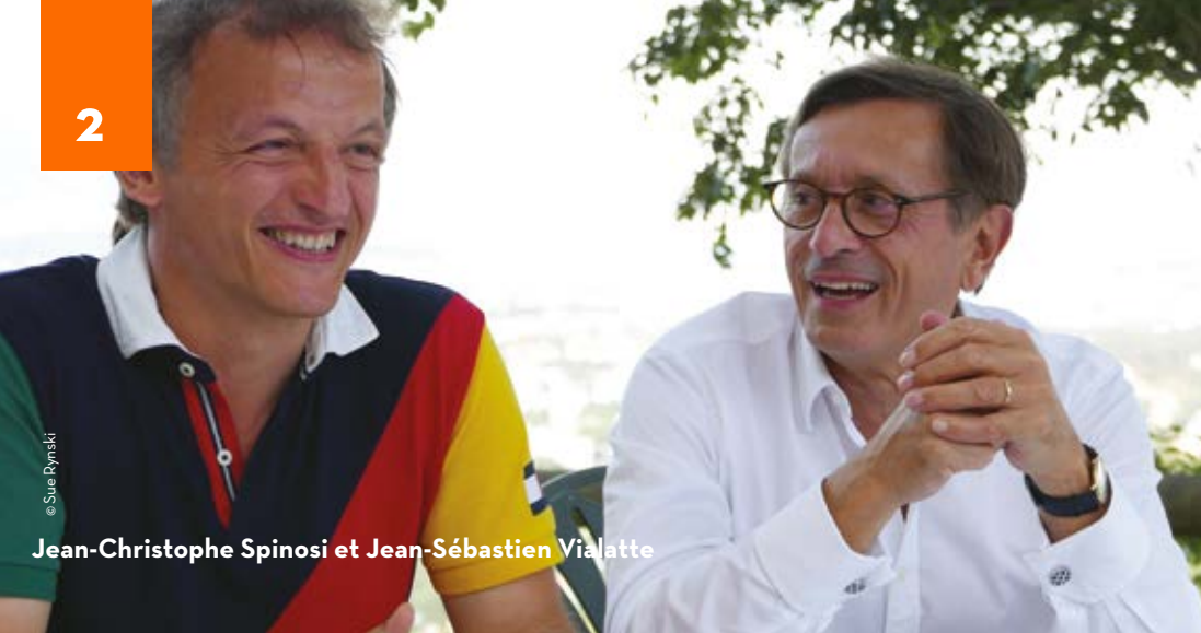
© Sue Rynski Jean-Christophe Spinosi et Jean-Sébastien Vialatte